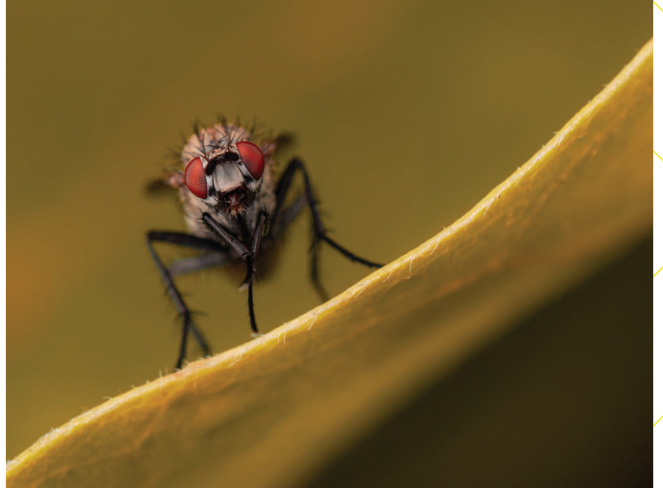
fot. Zbigniew Pukalski