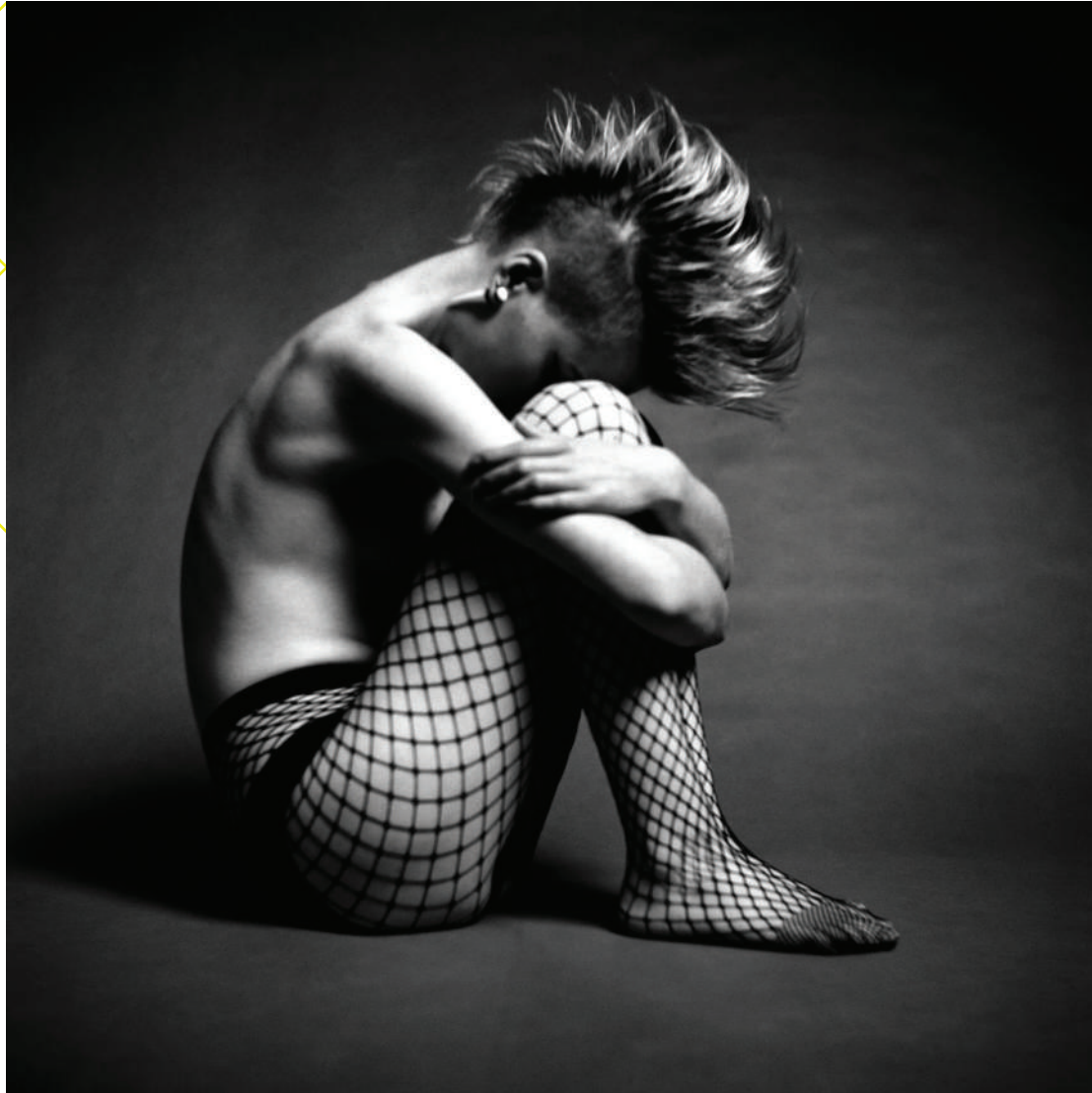
fot. Artur Wzorek